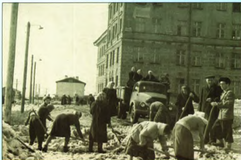
Благоустройство территории больницы. 1958 год

Быстро рос Прокопьевский рудник, а с ним росла и совершенствовалась служба здравоохранения. 1 января 1957 года на основании решения Минздрава СССР от 01.01.1957 и приказа Прокопьевского городского отдела здравоохранения на базе травматологического отделения образована Травматологическая больница. Это было обусловлено спецификой Прокопьевска, как «самого шахтерского» города области. В те нелегкие времена открытие больницы стало большим достижением в медицинском обслуживании шахтеров.